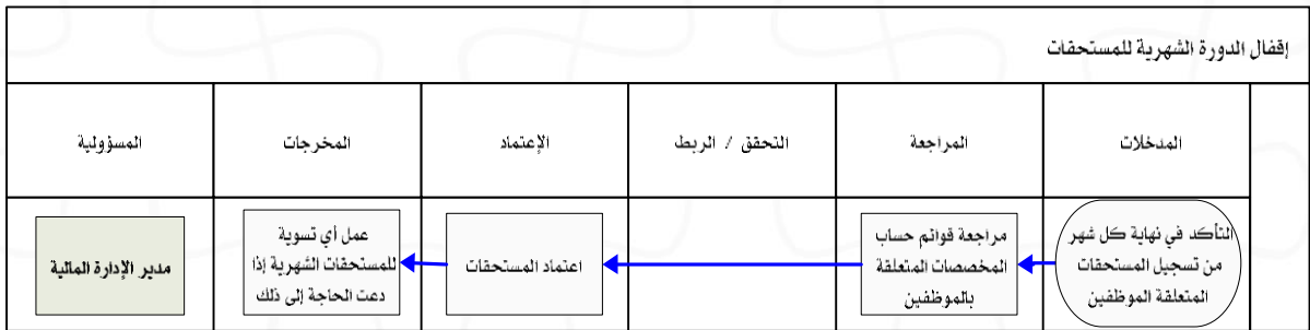
شكل رقم / ٥

يوضح المخطط البياني التالي ( شكل رقم/٥) طريقة تسلسل العمل لإقفال الدورة الشهرية للمستحقات: